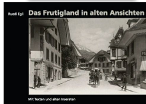
Mit Texten und alten Inseraten

Und viele weitere Broschüren, Bücher, CD's, DVD's