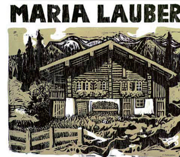
Die Frutigtaler Mundartdichterin liest aus ihren Werken