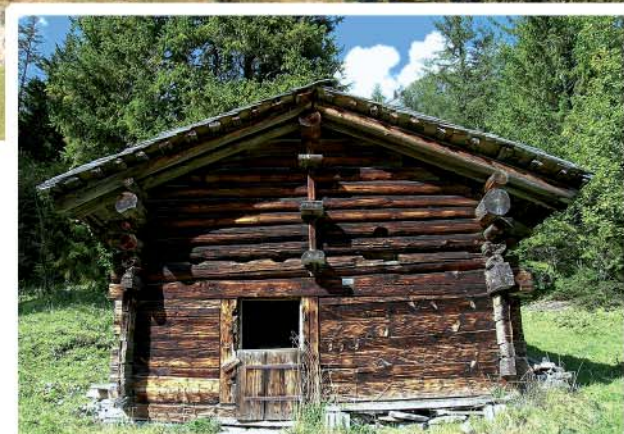
Schür bim Hüri