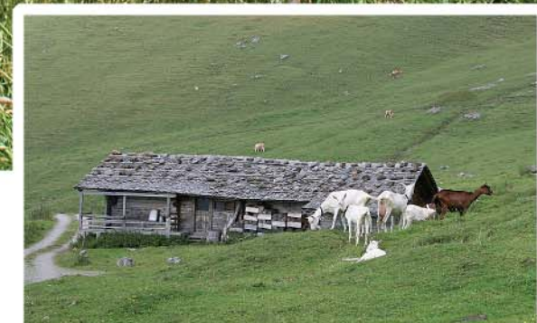
Stafel I de Schrickmatta