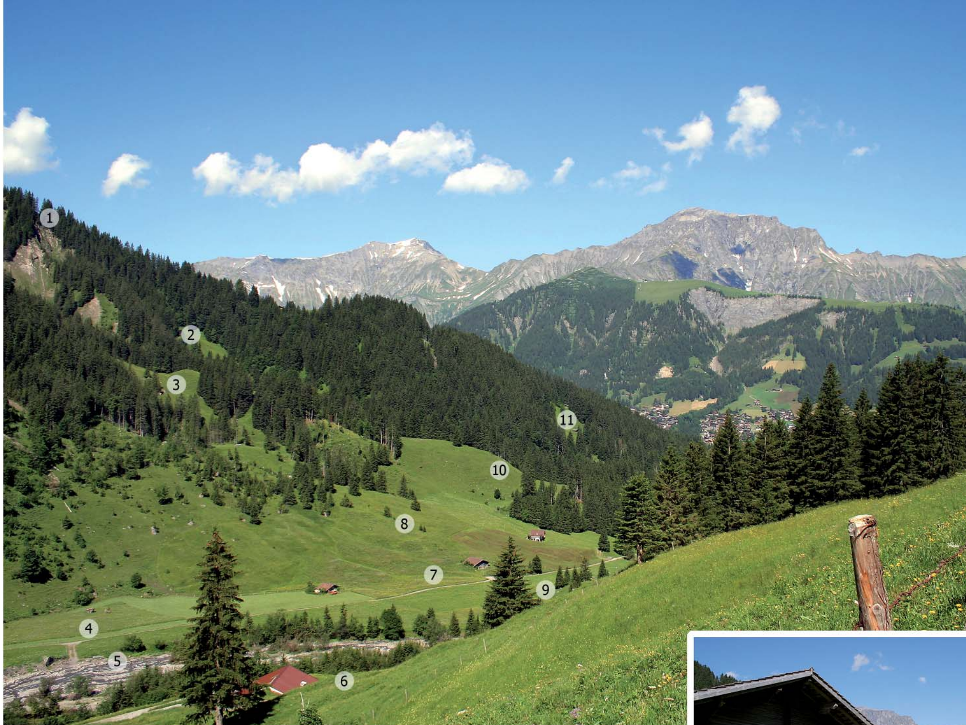
Weidhaus im Stäffelischwand