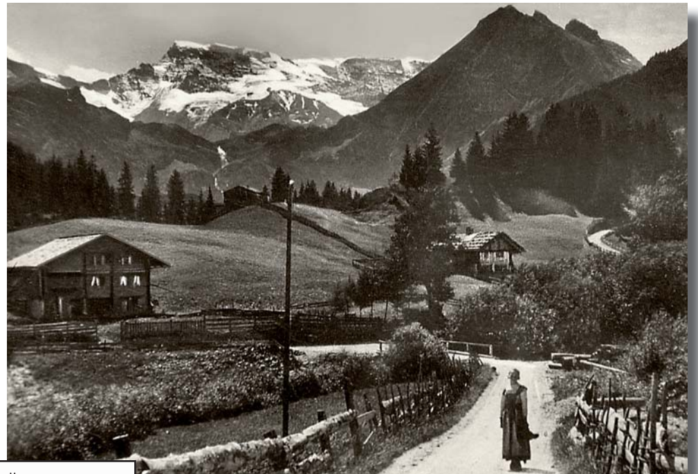
Schützebrügg zu verschiedenen Zeitepochen.