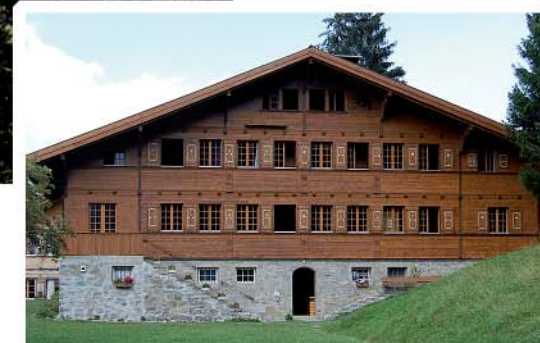
Our Chalet weltweit bekanntes Pfadfinnerinnenheim