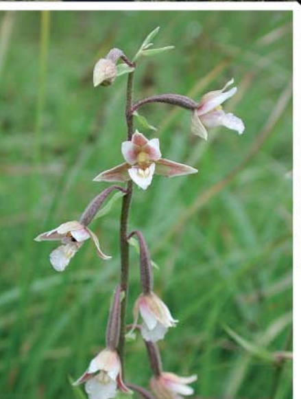
Weisse Sumpfwurz im Flachmoor