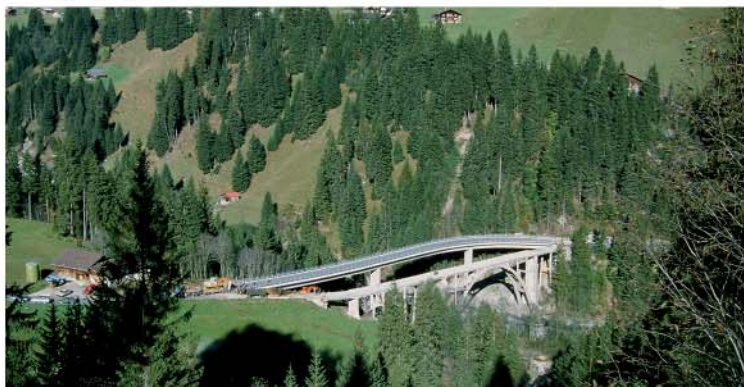
Alte und neue Rehärtibrücke