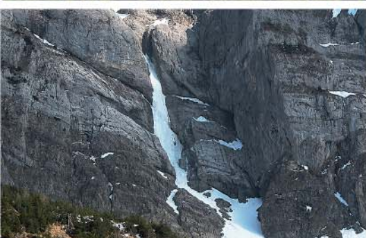
Zytgugel (16), wenn das Eis schmilzt, wird es Frühling