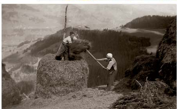
Tristen am Loner