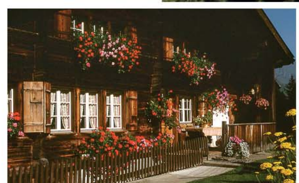
I der Lischa