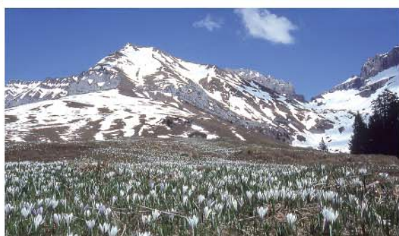
Seeli bir Seewlisweid (17)