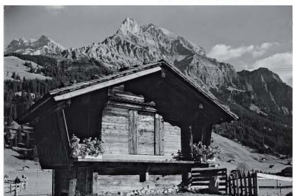
Spycher beim Restaurant Wildstrubel